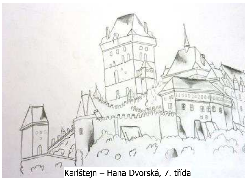
Karlštejn – Hana Dvorská, 7. třída

Salát, rukolu a ředkvičky řádně omyjeme. Ředkvičky, rukolu a balkánský sýr nakrájíme na menší kousky. Salát může být na kousky větší. Vše dáme do větší mísy. Připravíme si zálivku. Asi 3 polévkové lžíce vody, 1 čajovou lžičku soli, 2 čajové lžičky cukru a trochu pepře smícháme. Do rozmíchaného nálevu přidáme 1/2 polévkové lžíce balzamikového octa a stejné množství olivového oleje. Důkladně promícháme a zálivku nalijeme na salát. Promícháme a máme hotovo.