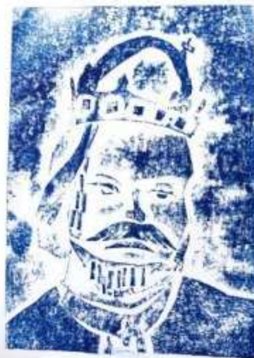
Karel IV. král český a císař římský