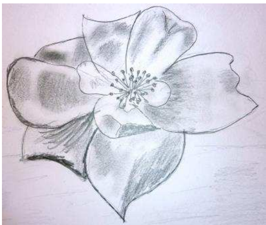
Nikča Ambrozová, 8. třída