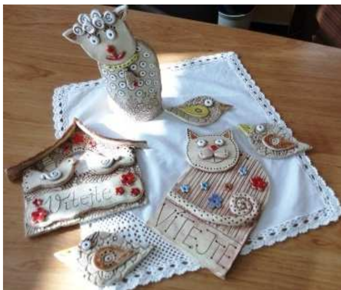
Velikonoční dílny rodičů