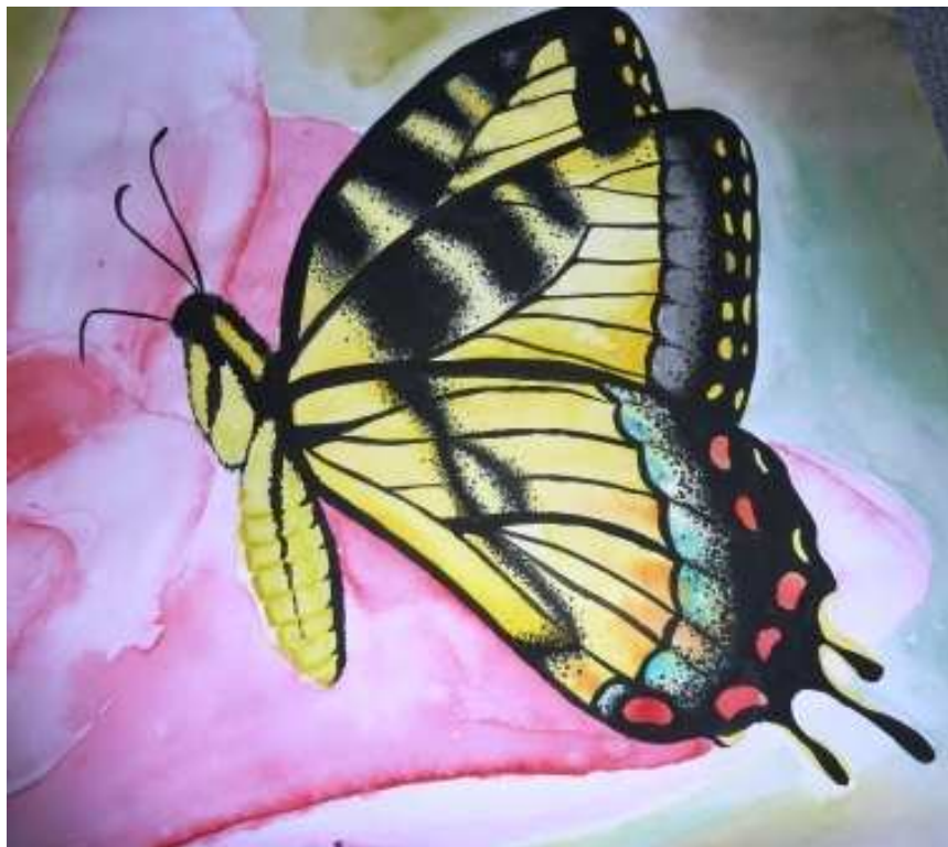
Petra PolISOVÁ, 9. třída

Sluníčko začíná pomalu hřát. Mezi posledními zbytky sněhu prokukuje nová letošní zelená tráva a vystrkují hlavičku poslové jara – bledule, sněženky, krokusy a petrklíče. Všechno v přírodě se probouzí k životu – semínka klíčí, ptáčci vesele zpívají nebo se vrací z teplých krajin. Pučící květy dávají teprve tušit budoucí vzrůst rostlin a později i úrodu. Kolik je v tom naděje a radosti!