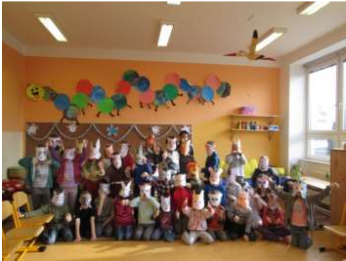
Projekt „Máme rádi zvířata“