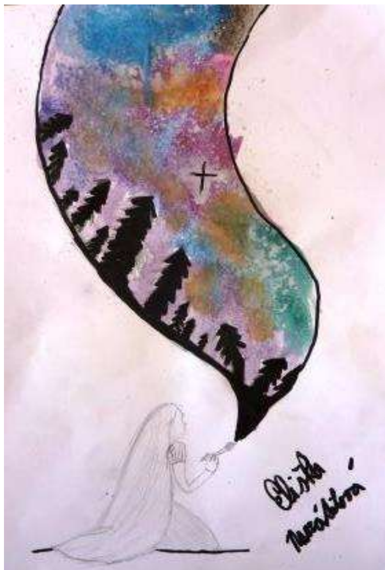
Eliška Navrátilová, 6. třída