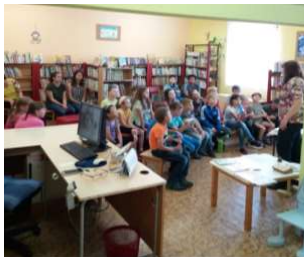
Čtenářský maraton v knihovně.