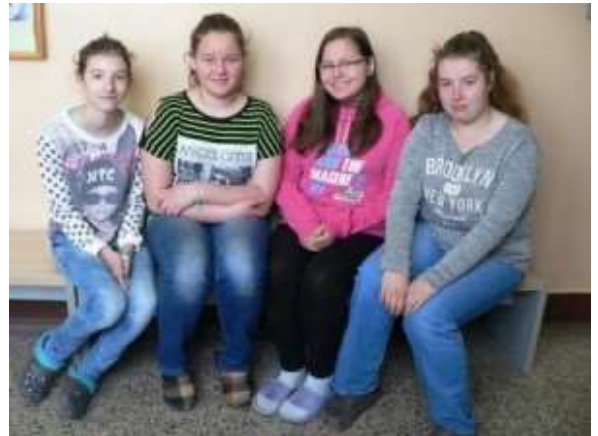
Máme šikovné přírodovědce!☺