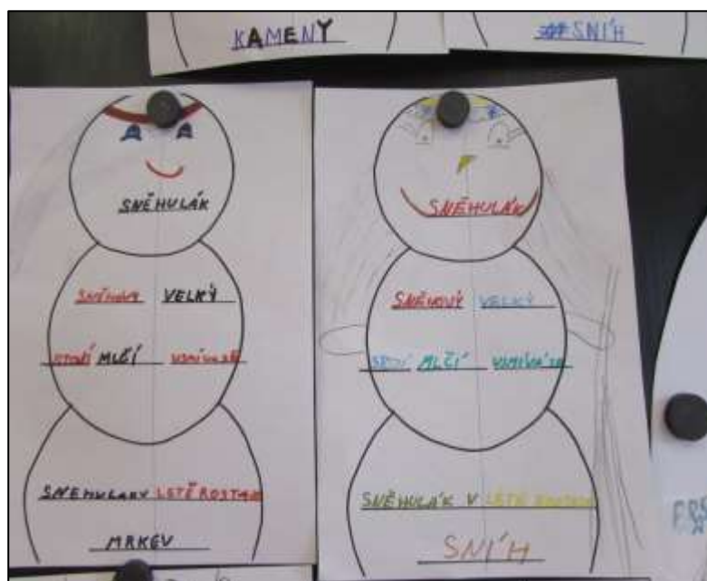
Pětilístek žáků 2. třídy

Za rozhovor děkuje Alexandra Dutzaková, 9. třída