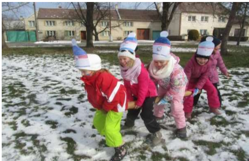
žáci a paní učitelky z 1. stupně

zlatou medaili - za vzornou přípravu na tento den a sportování ve smyslu fair play.