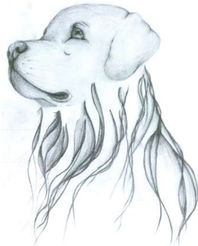
Kresba: Anna Štefanová, 8. třída