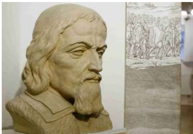
Busta J.A. Komenského