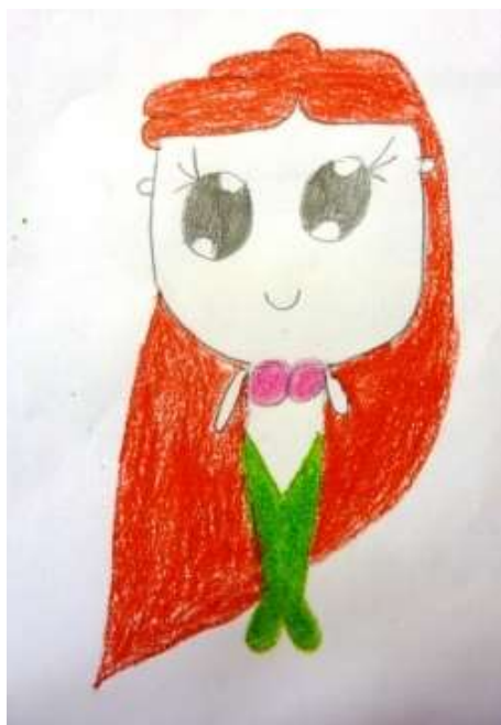
Karolína Ambrozová, 5. třída