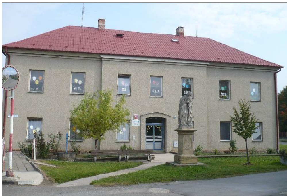
Budova prvního stupně (1. – 4. ročník)