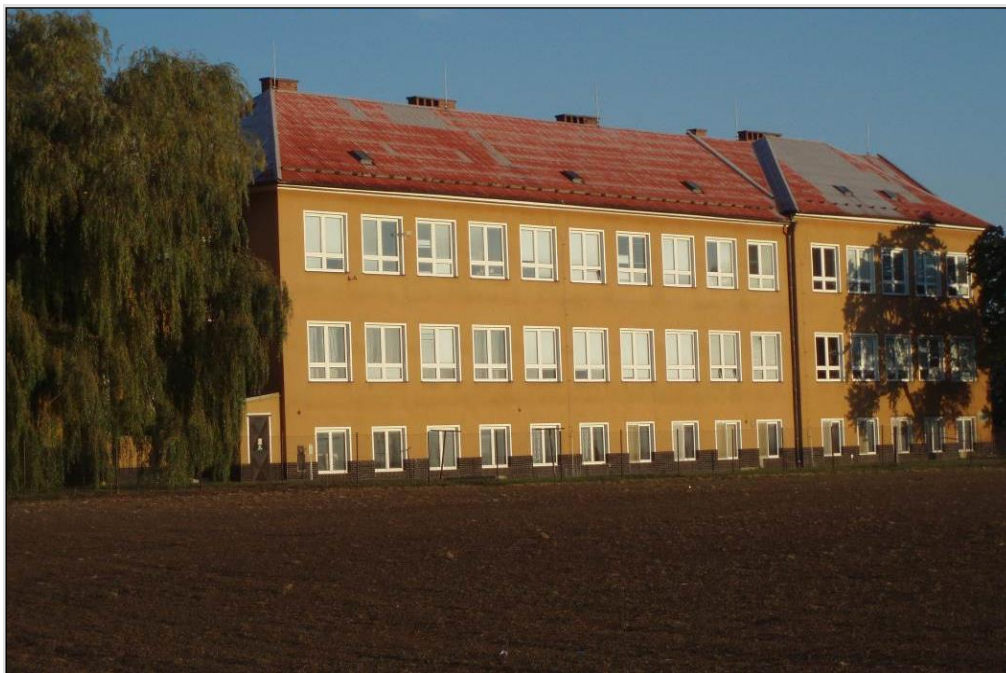
Hlavní budova (5. – 9. ročník)